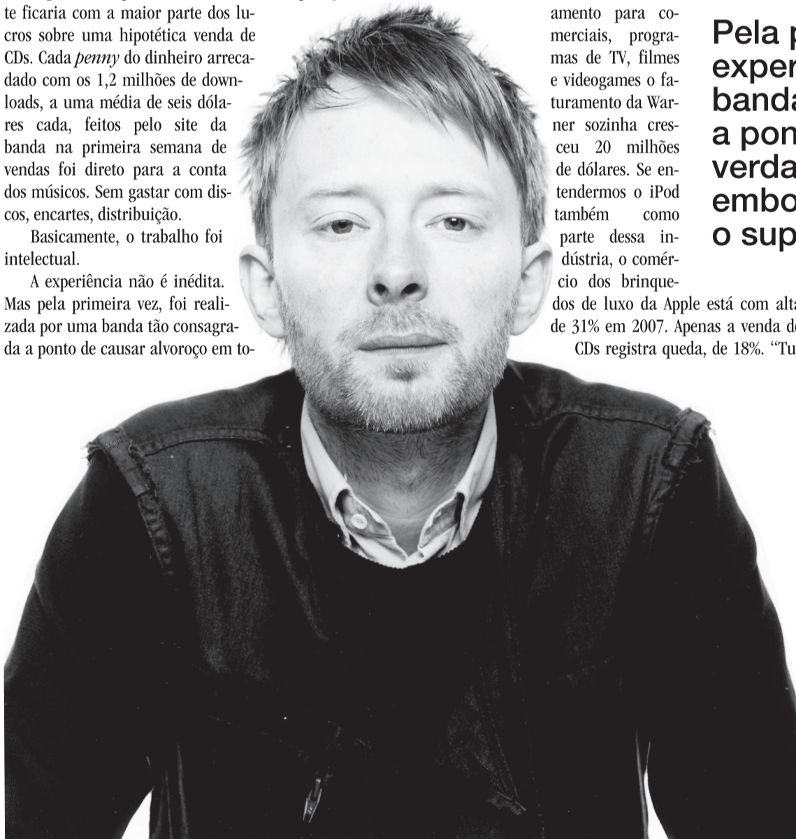
Thom Yorke, vocalista e guitarrista da banda inglesa Radiohead, aclamada por discos como Ok Computer e Kid A