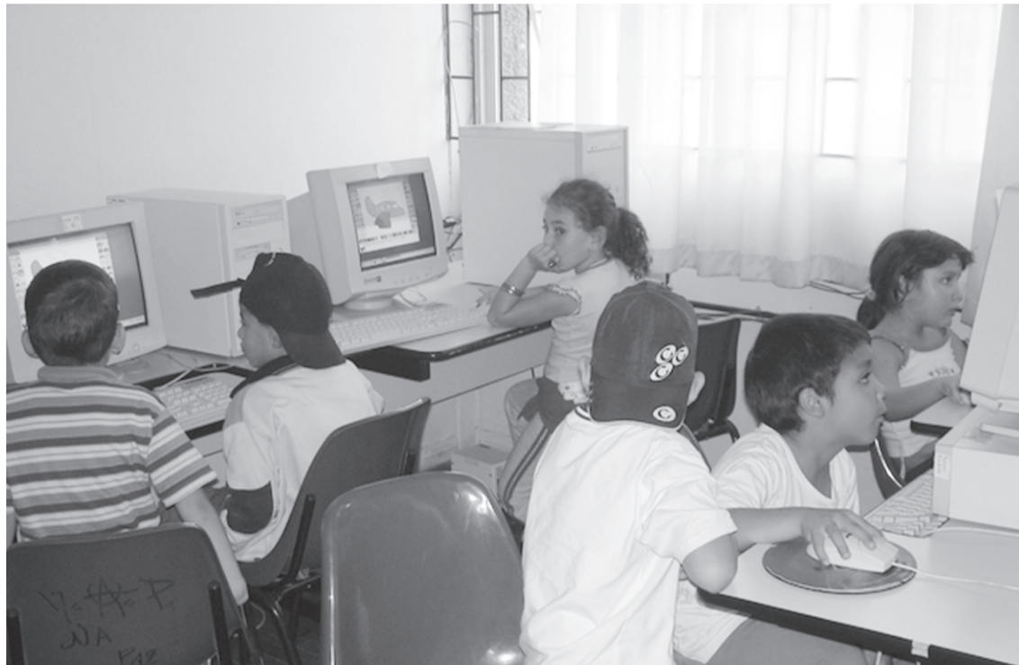
Com o Classe, as crianças da escola Simão Hess adquirem vocabulário, trabalham os sentidos e aprendem a mexer o mouse