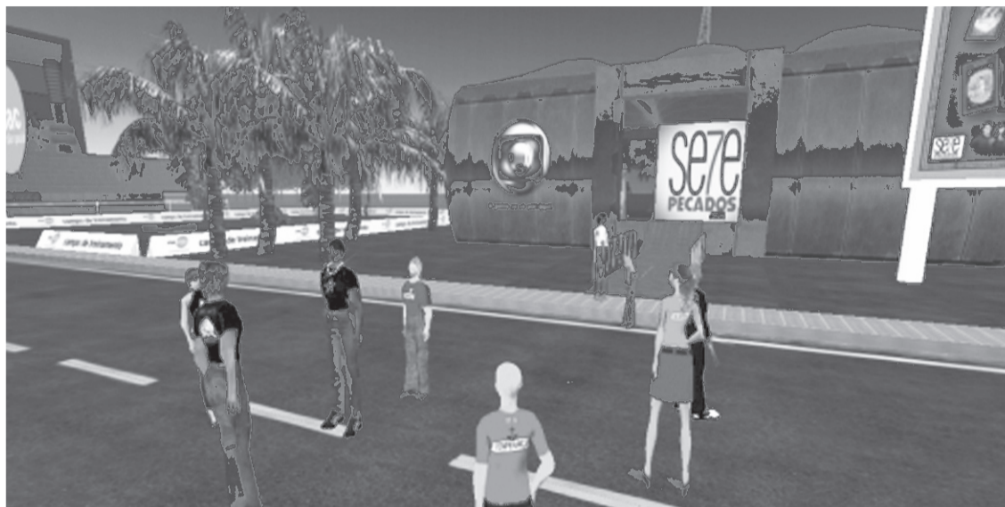
Em um mundo de realidade 3D na internet tudo é possível. Até mesmo as novelas brasileiras conquistam seu espaço.

A psicanálise trabalha com a idéia de que a maioria das pessoas já faz isso no dia a dia, imaginando-se no emprego ideal, com a famí-