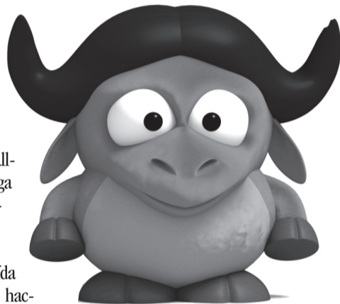
O Gnu, do projeto GNU e o pingüim Tux, do Linux, símbolos de softwares livres

to; de estudar como o programa funciona e adaptá-lo para as suas necessidades; de redistribuir cópias, de modo que você possa ajudar ao seu próximo; de aperfeiçoar o programa e liberar os seus aperfeiçoamentos, de modo que toda a comunidade se beneficie. O acesso ao código fonte é um pré-requisito para duas dessas liberdades. Além disso, o hacker também escreveu uma licença de Software — a GPL (General Public License). Esta licença, além de estabelecer as tais quatro liberdades, sendo, portanto, uma licença de Software Livre, é tam-