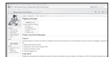
Classe, Edumatec e Visconde de Sabugosa são os três projetos de classificação de softwares educativos desenvolvidos no Brasil