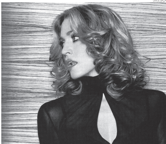
Madonna sai da Warner e assina contrato com uma produtora de shows

vincular vídeos em sua programação porque esse formato passara a ser para um formato de web, não de televisão. A emissora disponibilizaria seu acervo apenas no portal MTV Overdrive, um lixo pesado e lento se comparado ao Youtube.