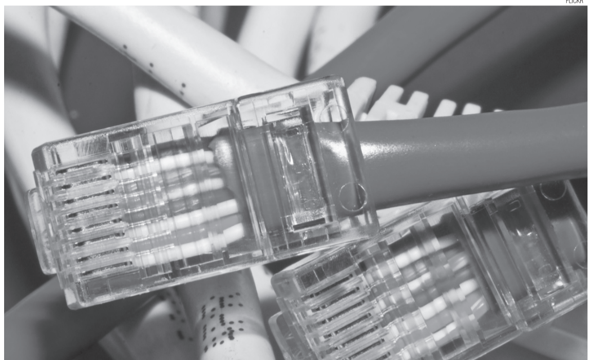
O Brasil é o único lugar do mundo onde além de pagar pela conexão também se paga por provedores de acesso

Apesar de não fazerem a conexão com a rede, os provedores passaram a