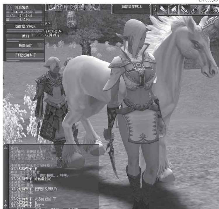
MMOs como o Lineage são a mais nova promessa de lucratividade na internet

Por ser extremamente recente, lucro substancial por parte dos usuários é praticamente impossível. Salvo raras exceções, como é o caso chinesa naturalizada alemã Ailin Graef - avatar Anshe Chung - que virou notícia no mundo inteiro ao juntar US$ 1 milhão comprando e vendendo imóveis virtuais. Tudo isso em pouco mais de dois anos. A empresa brasileira Kaisen Games desenvolve a versão nacional para o Second Life. Específico para brasileiros, o jogo é