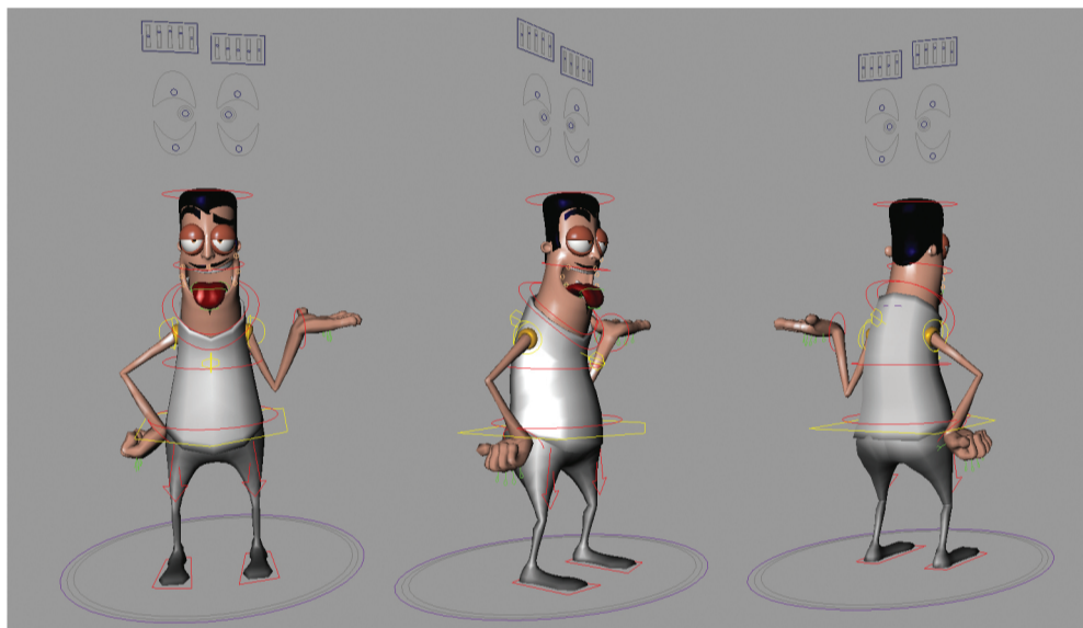
Personagem do filme Mágica! na animação. As linhas coloridas são como cordas de um boneco ventríloquo

Nessa época, o mercado de publicidade era dominado pela Rede Globo, que tinha criado a Globo Computação Gráfica e realizava os primeiros comerciais, além das vinhetas do próprio canal. No entanto, em pouco tempo a Globo CG saiu do mercado publicitá-